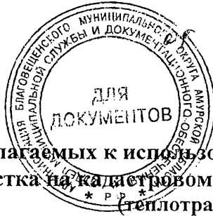
Схема границ предполагаемых к использованию земель или части земельного участка на кадастровом плане территории (теплотрасса)